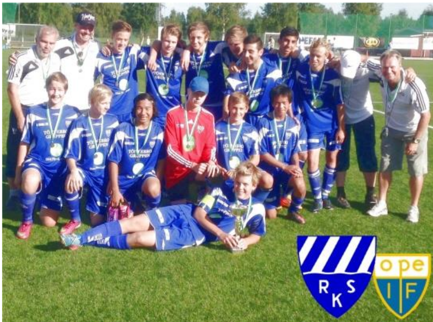
Match mot Ope.

Vi i U17 började i november 2013 med att slå ihop truppen med A-truppen så vi fick en gemensam träningsgrupp. Efter hand var det dags för seniordebut i Ljusnan Cup där vi ställde upp med ett U17-lag. Resultaten var varierande men det var en bra erfarenhet av seniorspel. Sen kom vi ut på Solrosen och körde tre pass i veckan och efter hand började träningsmatcherna och det blev 4 till antalet.